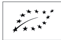
IT BIO 777 Agricoltura ITALIA

Gli alimenti costituiti per almeno il 95% da ingredienti biologici possono riportare le stesse informazioni di quelli integralmente biologici a patto che: